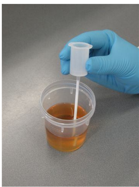
1. Plaats het rietje (straw) in de urine. (Wees voorzichtig met de scherpe naald in de straw).