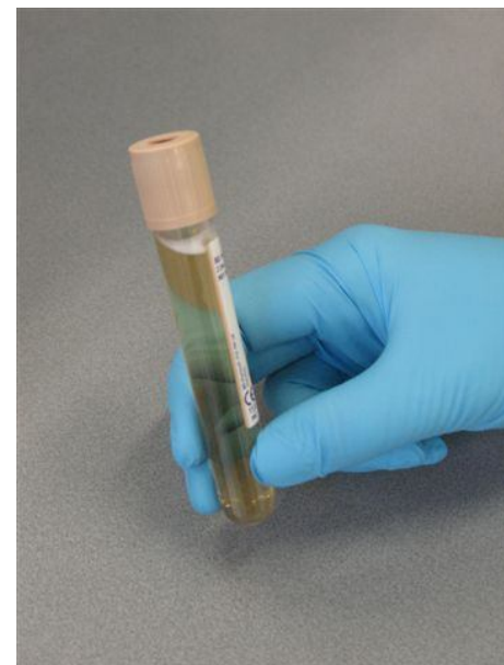
5. Verstuur buis en aanvraagformulier naar het LMMI.