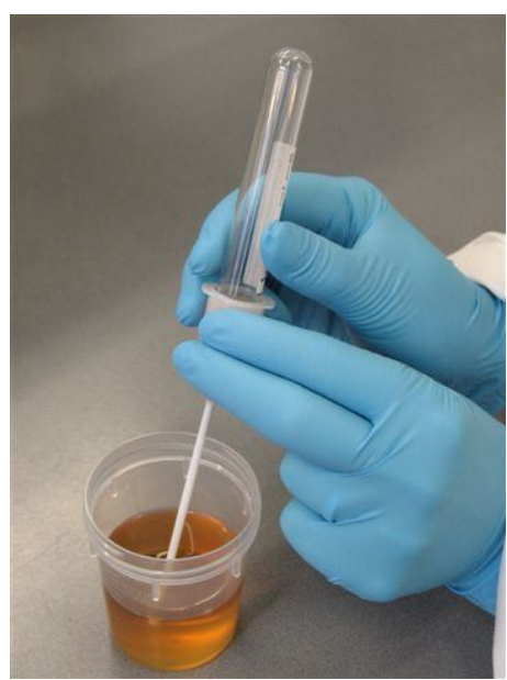
2. Druk de buis op de naald in de koker. (Verwijder nooit de dop van de buis; de buis is vacuüm en na verwijdering niet meer bruikbaar).