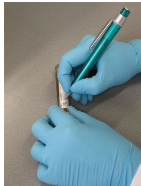
4. Voorzie de buis van naam en geboortedatum.