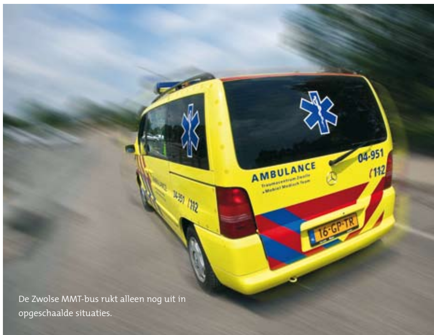
De Zwolse MMT-bus rukt alleen nog uit in opgeschaalde situaties.

Kun je daaruit concluderen dat een 'demissionair' MMT mensenlevens kost? 'In geval