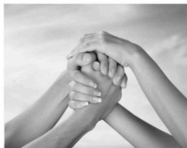
Diewerke van Losenoord

Verbinding vraagt loslaten, open staan voor iets nieuws, samenwerken en wederkerigheid door elkaar te helpen en steunen. Wat is het mooi dat ik die verbinding heb mogen ervaren en onderdeel heb mogen zijn van dit specifieke harmonisatieproces. Dit biedt nog zoveel moois richting de toekomst.